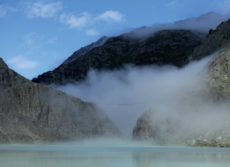
Der natürliche Triftsee mit der berühmten Hängebrücke. Die Staumauer würde die Brücke um rund 30 m überragen.

Die geplante Umlagerung von 200 GWh vom Sommer- ins Winterhalbjahr durch das Triftprojekt entspricht nur 0,6% des Landesverbrauchs im Winterhalbjahr (2018/19: 33832GWh). Allein zum Ersatz des aktuellen Stromimportes wären 25 Triftanlagen notwendig. Für den Ersatz des in den nächsten Jahrzehnten wegfallenden Atomstromes wären weitere 65 Triftspeicherseen notwendig.